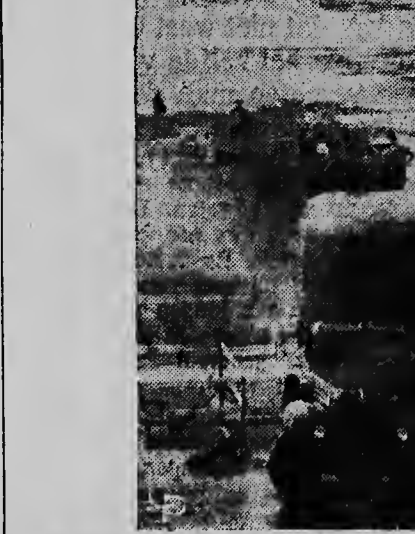
E trucknan aki a hanja nan den problemanan di trafico basta difi. Esun na front ta un tandem axle trailer den un test di parkeer. Paga tino con cerca e barricadanan ta keda dilanti i patras. E chauffeur mester stuur door di nan, Na man drech i truck tin cu back na sistema di serpen tina mei-mej di algun barril y e truck cu trailer mas patras ta mas o menos para un banda sin hasi nada. E competencia aki a tuma lugar na Ohio durante di un temporada pa scoge e chauffeurnan cu a haci menos accidente di trafico y cual ta mas apto den stuurmento.